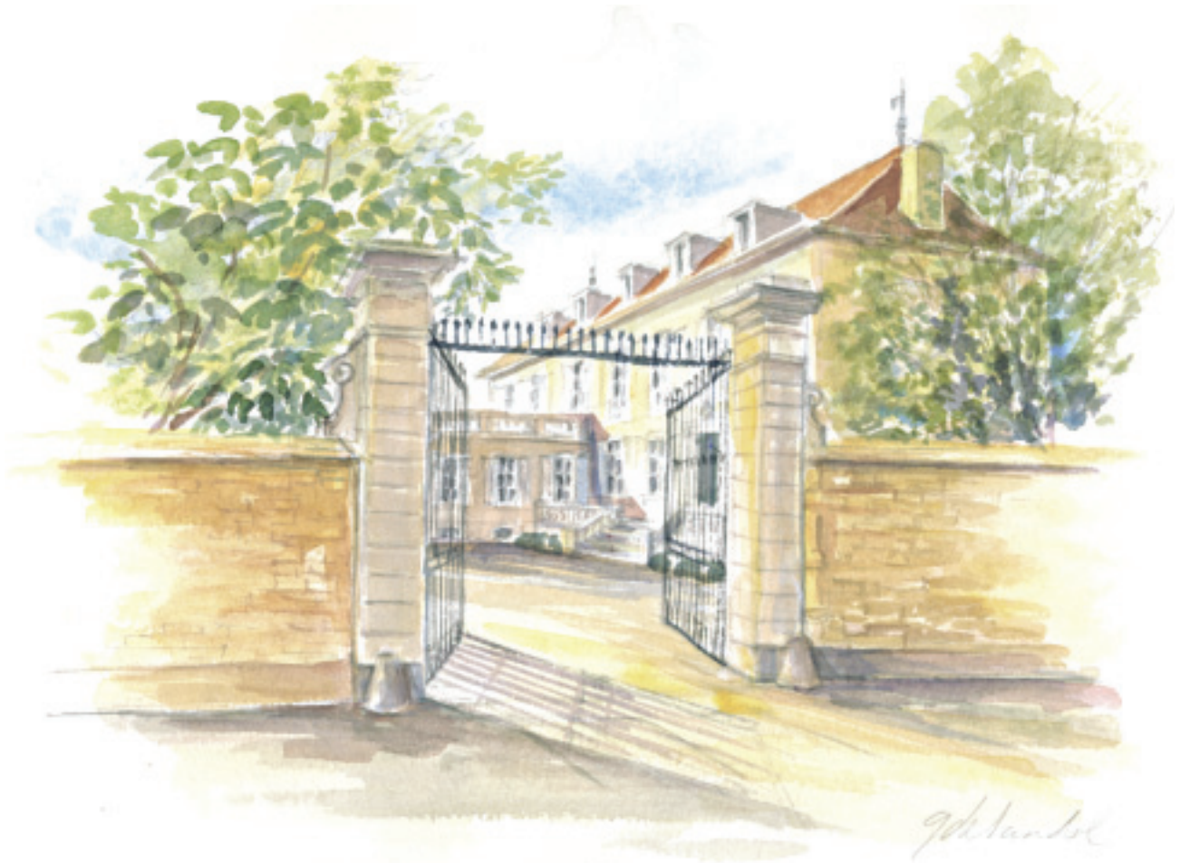
Château Labouré-Roi, Meursault, Côte d'Or.