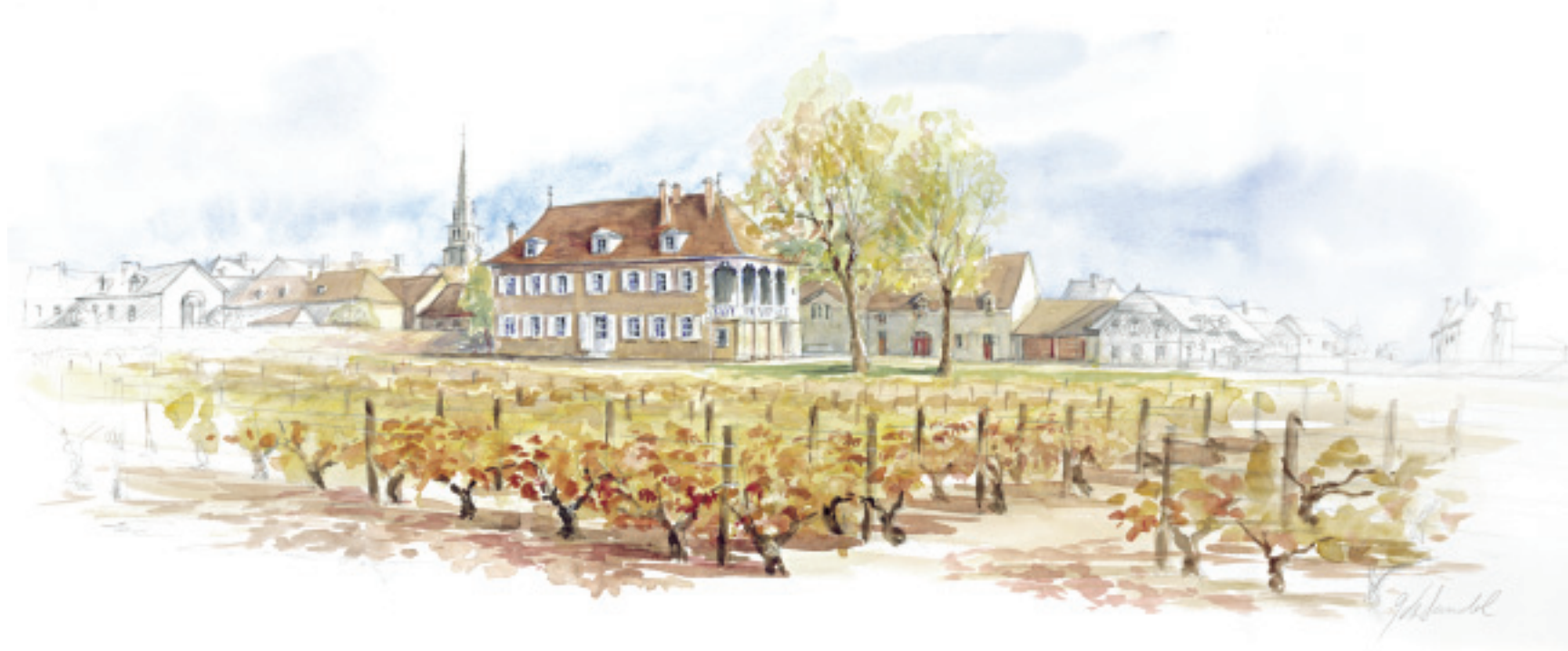
Le Clos de la Baronne au Château Labouré-Roi